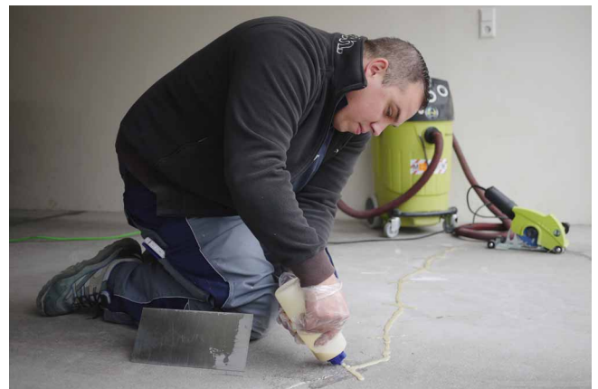
Трещины и прорезы тщательно очистить пылесосом, затем в прорезы вложить скобы для стяжки, и нанести UZIN KR 516.