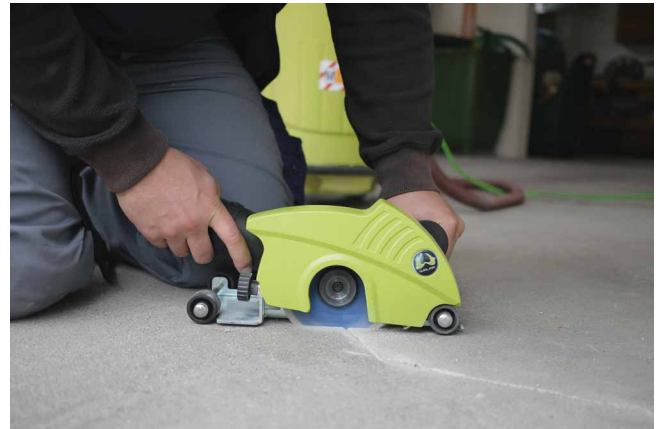
Трещины и швы открыть фрезой Wolff EF135, а также нарезать перпендикулярные прорезы.